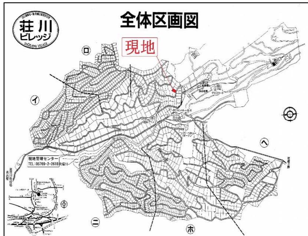
*間取図・区画図と現況が相違する場合は現況を優先と致します