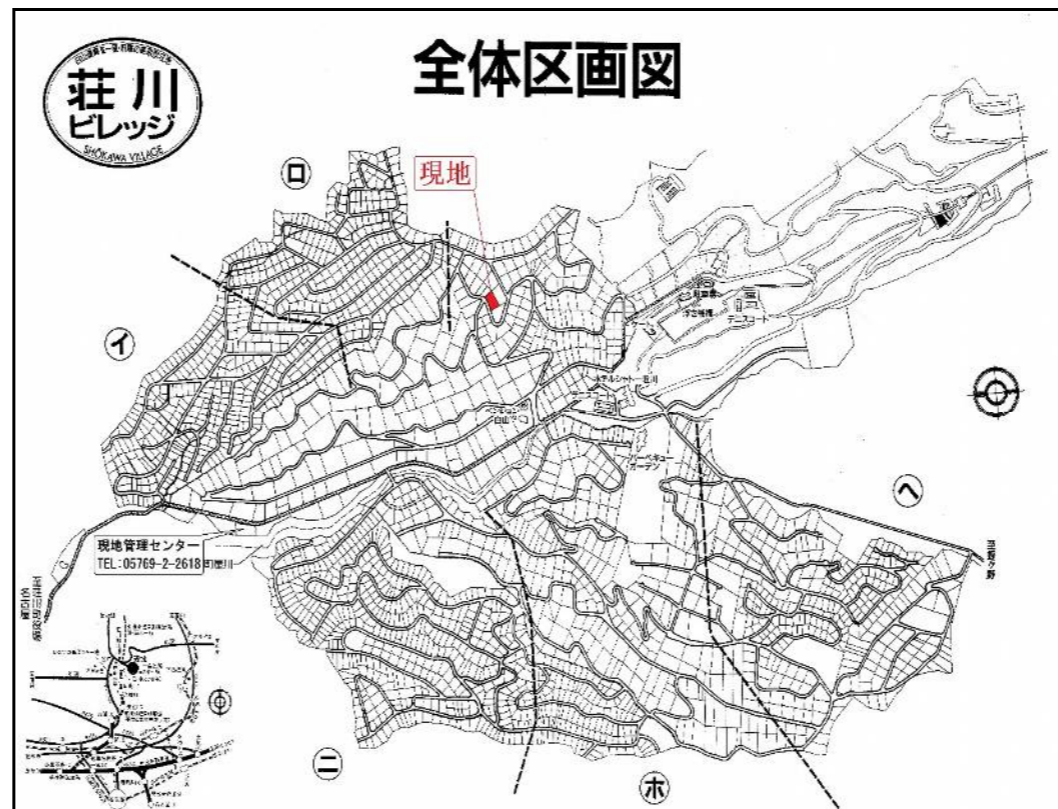
*間取図・区画図と現況が相違する場合は現況を優先と致します