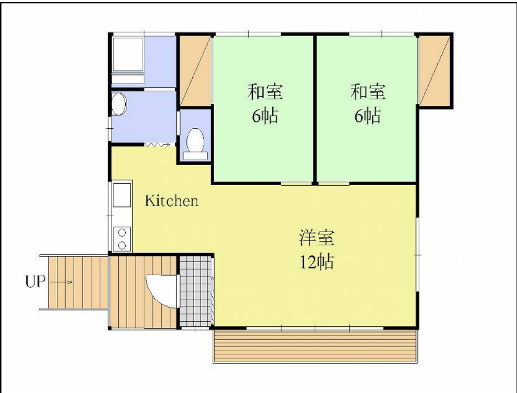
＊間取図・区画図と現況が相違する場合は現況を優先と致します