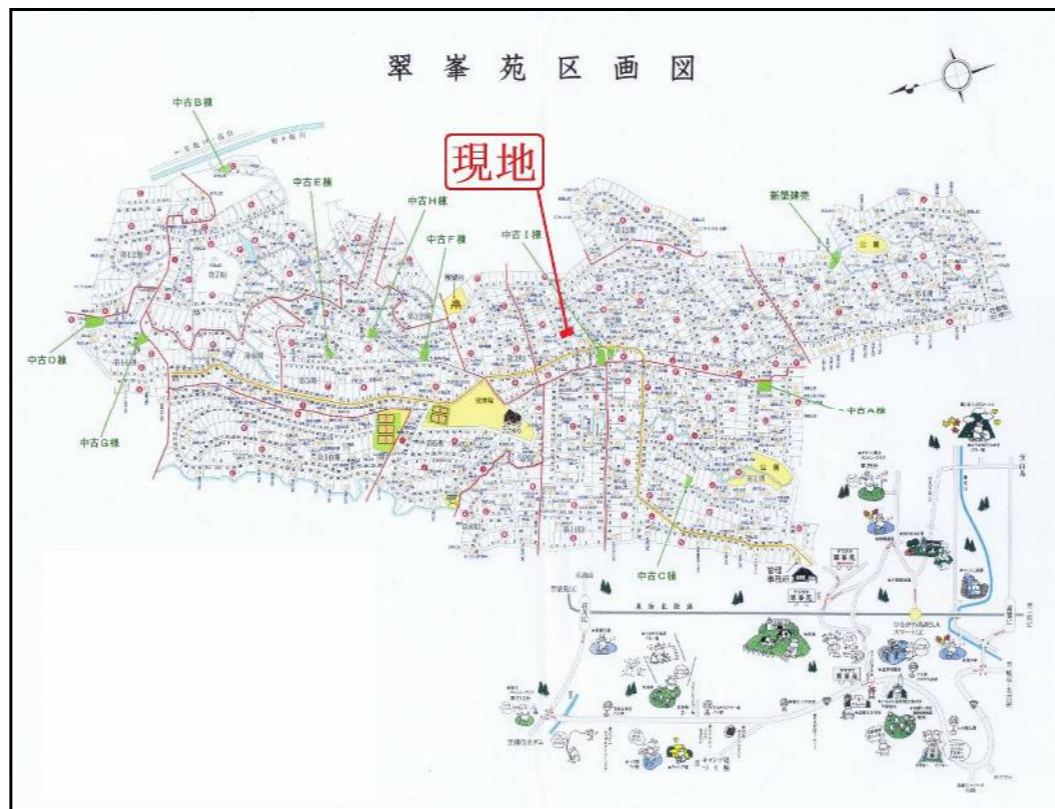
*間取図・区画図と現況が相違する場合は現況を優先と致します