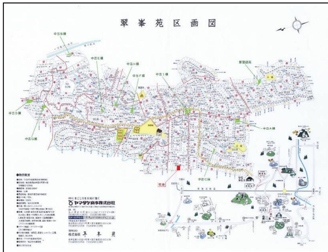
*間取図・区画図と現況が相違する場合は現況を優先と致します